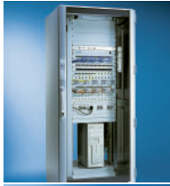
Informatie en Communicatie Technologie

Frontplaatbewerkingsservice · Assemblageservice Systeemintegratie tot Level 4