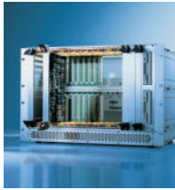
Electronic Packaging Systems

Microcomputer opbouwsystemen · Voedingen Subracks · Tafelbehuizingen · Wandbehuizingen Elektronica-kastsystemen